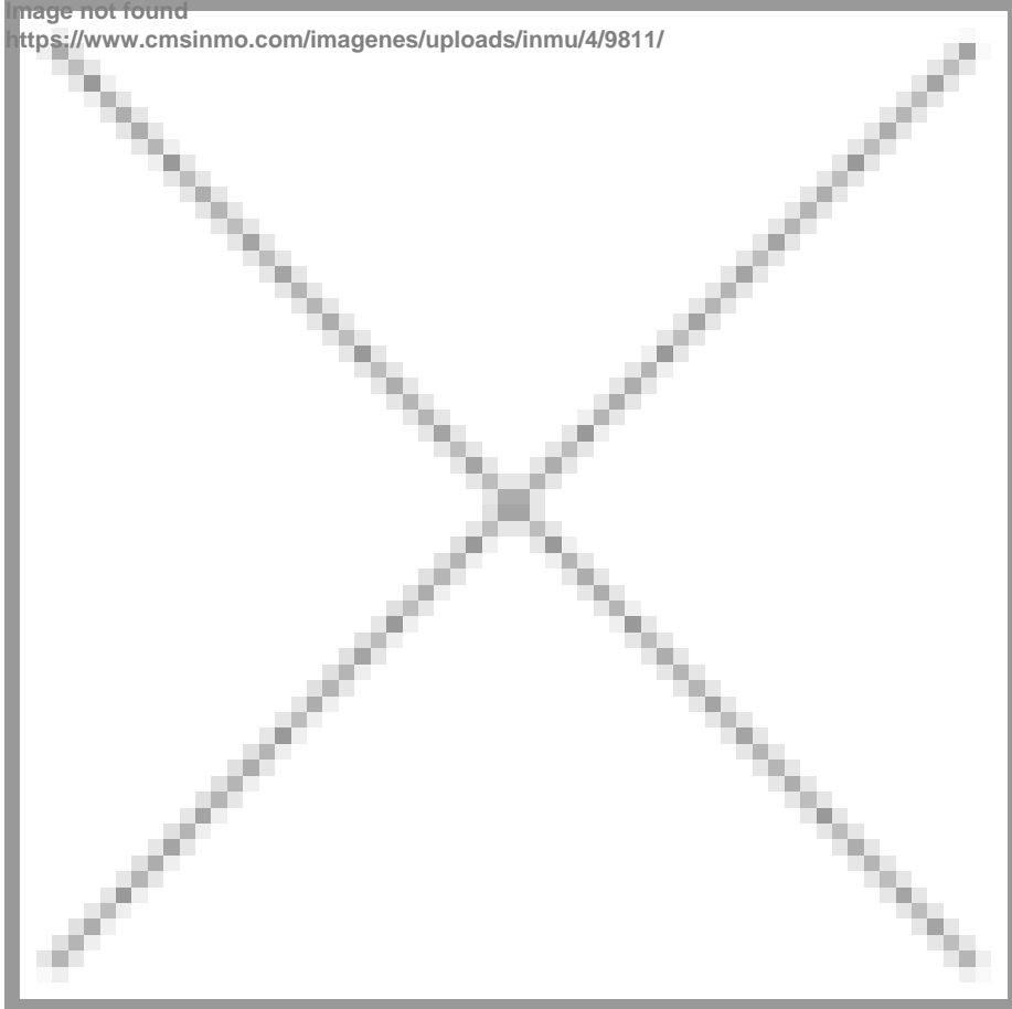
Image not found https://www.cmsinmo.com/imagenes/uploads/inmu/4/9811/