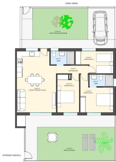
ESQUEMA PLANTA BAJA