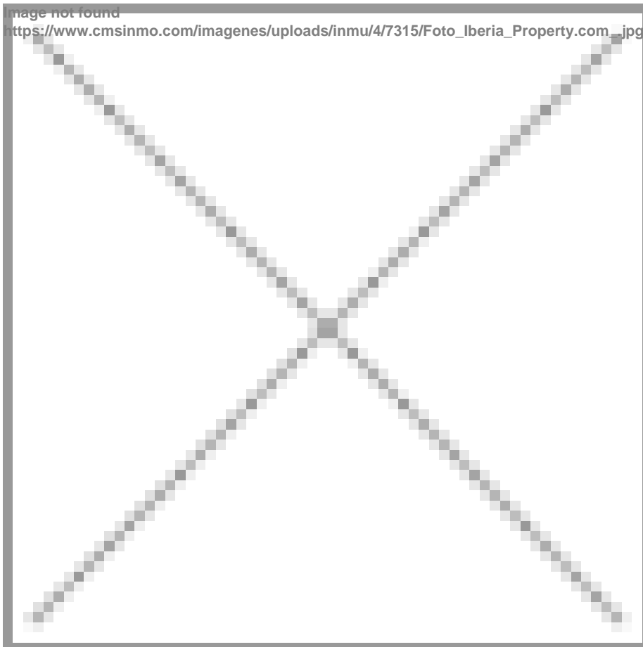
image not found https://www.cmsinmo.com/imagenes/uploads/inmu/4/7315/Foto_Iberia_Property.com_.jpg