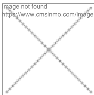
image not found https://www.cmsinmo.com/imagenes/uploads/inmu/4/7315/Foto_Iberia_Property.com_.jpg