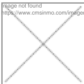
image not found https://www.cmsinmo.com/imagenes/uploads/inmu/4/7315/Foto_Iberia_Property.com_.jpg